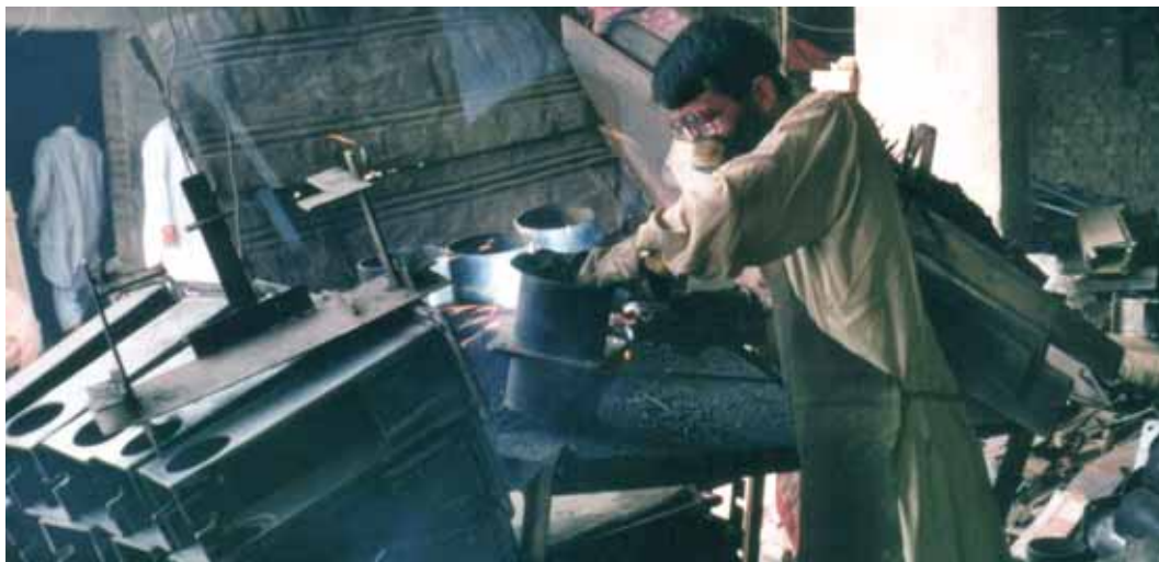
Produktion von Handpumpen durch das örtliche Kleingewerbe, Indien

Ein Grossteil dieser Wirkungen hat einen direkten Bezug zur guten Regierungsführung (Gouvernanz). Sowohl auf lokaler, wie auf