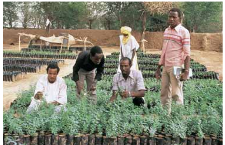
Mehr Produktion mit Bewässerung: Baumschule im Niger