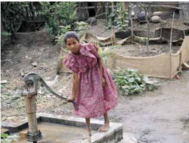
Handpumpe in Bangladesch

Zudem muss in den meisten Trinkwasserprogrammen die Entsorgungskomponente (Abwasser, Latrinen) noch verstärkt werden. Durch den erhöhten Anfall an Abwasser bei der Verbesserung der Trinkwasserversorgung ist dies zusätzlich wichtig.