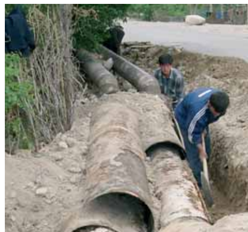
Erneuerung des Verteilnetzes in Khujand

Im Ferghana-Tal (Zentralasien) hat die Schweiz die Modernisierung der Bewässerung und Landwirtschaft unterstützt. Davon profitieren direkt und indirekt sogar 680'000 Personen auf 1700 km 2 Land.