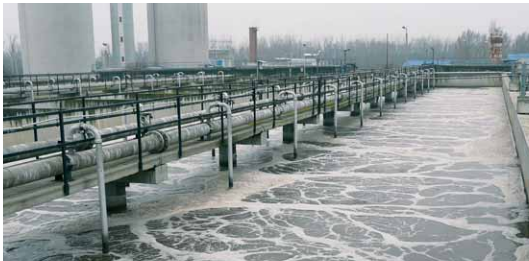
Anlage zur Wasserreinigung in Debrecen, Ungarn