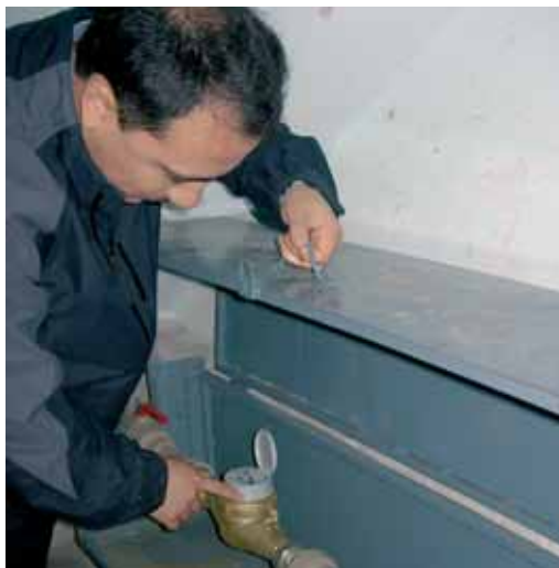
Khujand: Wassermeter sind wichtig für Gleichbehandlung der NutzerInnen und deren Zahlungsmoral

Alle untersuchten Vorhaben zeigen positive Wirkungen auf Rahmenbedingungen: Wirtschaftliche Impulse, Konfliktmanagement, Umweltschutz, starke Ver- und Entsorgungsunternehmen und gute Regierungsführung.