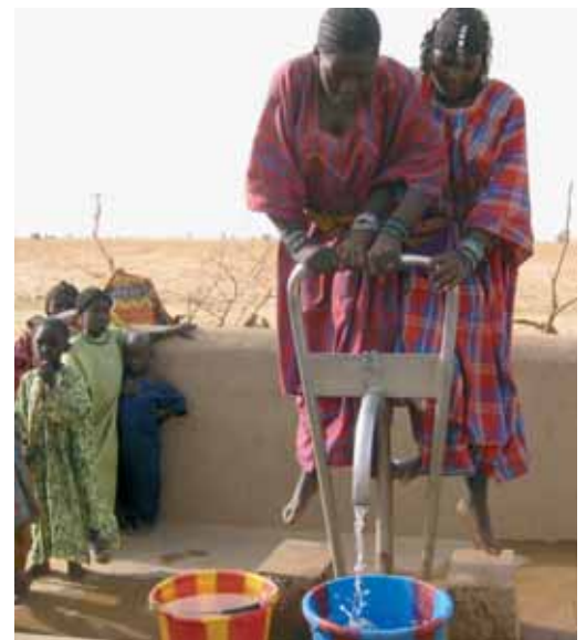
Nutzen entstehen vor allem für Frauen und Kinder

Der Nutzen ist auf dem Gebiet der Produktionssteigerungen relativ einfach zu berechnen. Andere Wirkungen, die darüber hinausgehen (z.B. bessere Konfliktregelung), wurden nicht einbezogen.